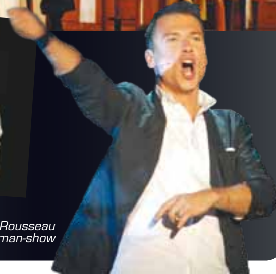
Stéphane Rousseau en one-man-show