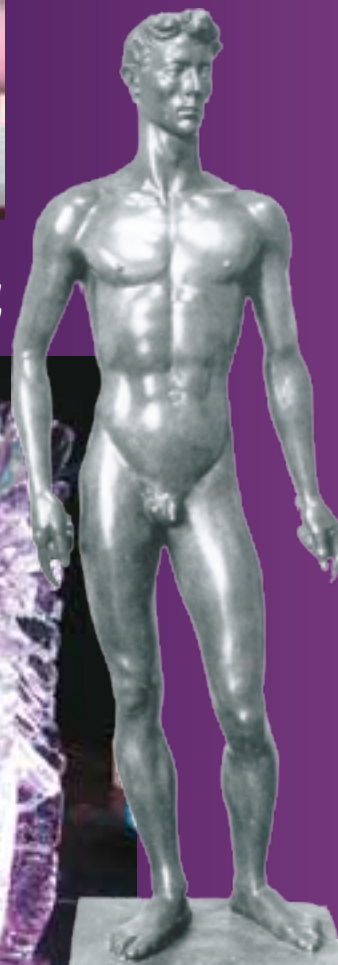
Exposition Paul Belmondo